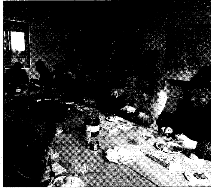
Столовата в гимназията, където се хранят всички ученици, защото остават в училището до 16 ч.

Впечатляваща е била и разходката, организирана от домакините, из прочутите швейцарски Алпи. Така с очите си